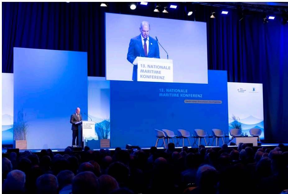
Bundeskanzler Olaf Scholz auf der 13. Nationalen Maritimen Konferenz in Bremen