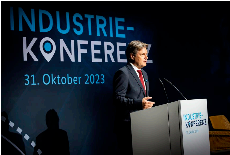
Bundesminister Dr. Robert Habeck auf der 6. Industriekonferenz des BMWK in Berlin